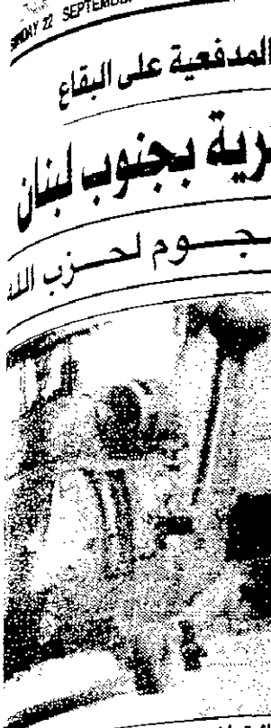
لأكثر من عشرة على الجنوب وفي بيروت أعلن حزب الله مسؤوليته عن الهجمات وقال مقاتليه أطلقوا الصواريخ على ديبانة وهاجموا مقره في الغربية وبيروت وكنات على اسرائيلية في اغارة على على اقليم الغار في جنوب الغربية الاسرائيلية للقطاع في ذلك قري بسيف عليها التي هلك ردا على جنود اسرائيليين وجرح ثمانية اسلامية تسعى لطردهم الاسرائيليين من المنطقة تحطيا اسرائيل في جنوب منذ عام ١٩٨٥